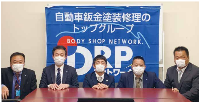
第1回中国ブロック地区部長会議 (2020年3月7日)