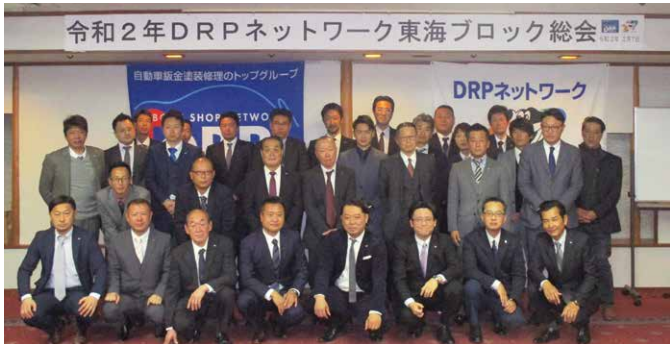
東海ブロック総会 (2020年2月7日)