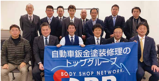
第1回首都圏甲信越ブロック地区部長会議 (2020年1月25日)