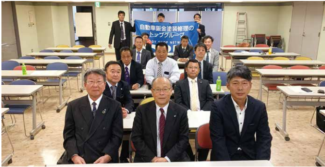
中国ブロック勉強会 (2019年11月2日)