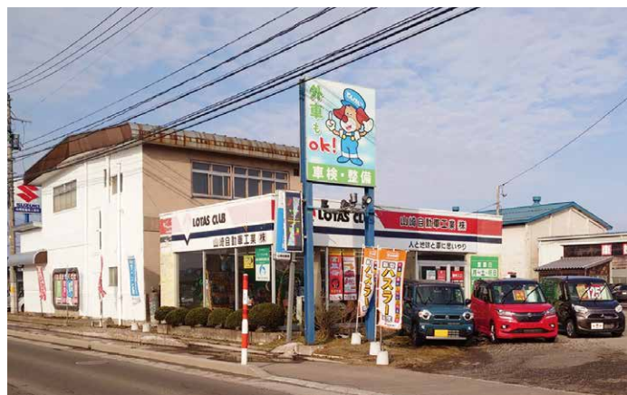
山崎自動車工業株式会社 秋田県鹿角市花輪字蒼前平