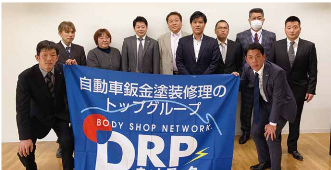
第1回四国ブロック会議 (2020年3月6日)