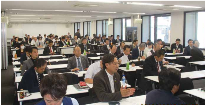
首都圏甲信越ブロック勉強会 (2019年11月16日)