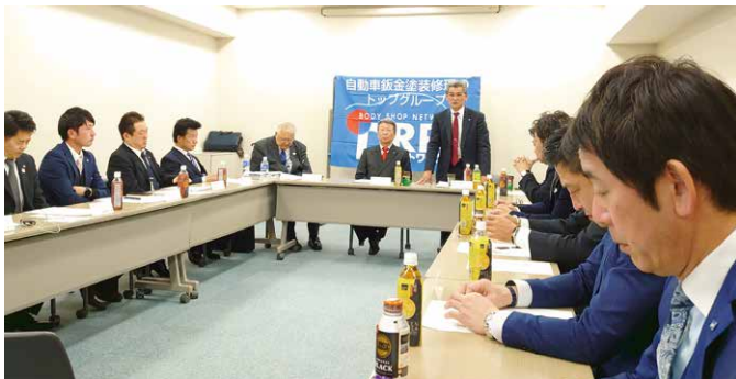
第1回全国ブロック長会議 (2020年1月18日)