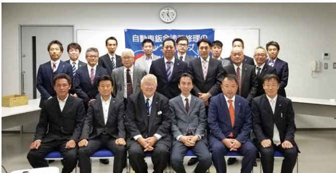
北陸ブロック勉強会 (2019年11月16日)