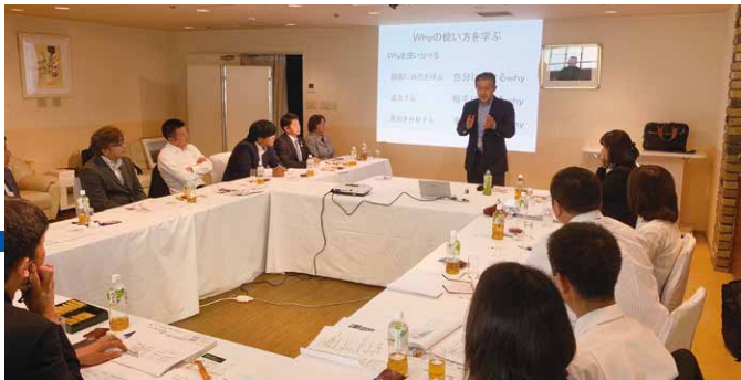
四国ブロック勉強会 (2019年10月26日)