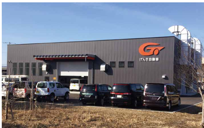
げんき自動車株式会社 青森県青森市大字八ツ役字矢作