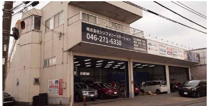
株式会社シンフォニスステーション 神奈川県大和市下鶴間