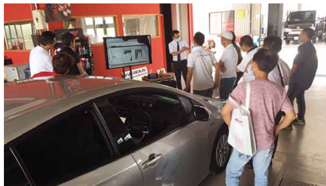
愛知地区「ADAS講習会」開催 (2020年7月12日)