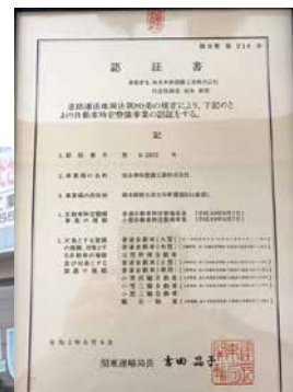
坂本車体整備工業株式会社 栃木県栃木市