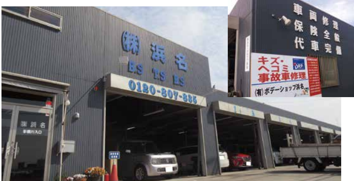
有限会社ボデーショップ浜名 神奈川県海老名市本郷