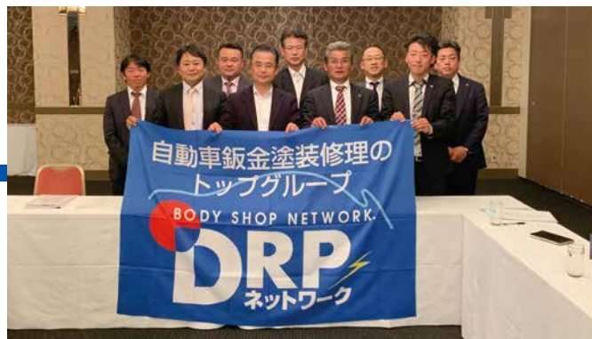
第1回九州ブロック地区部長会議 (2020年3月14日)