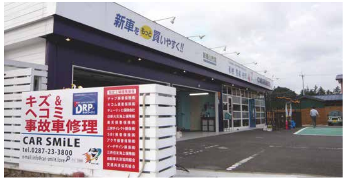
CAR SMILE 栃木県大田原市中田原