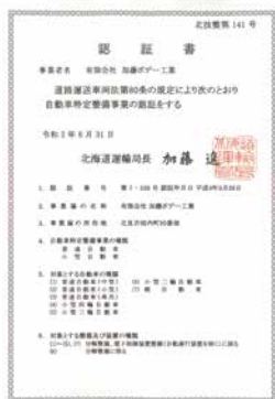
有限会社加藤ボデー工業 北海道北見市