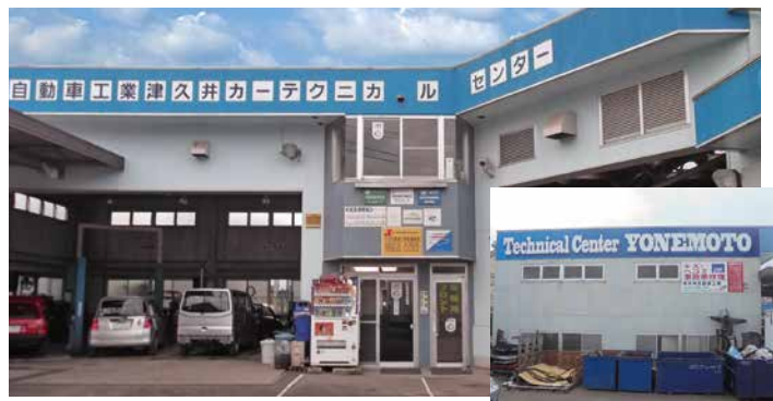
有限会社米本自動車工業 神奈川県相模原市緑区三ヶ木