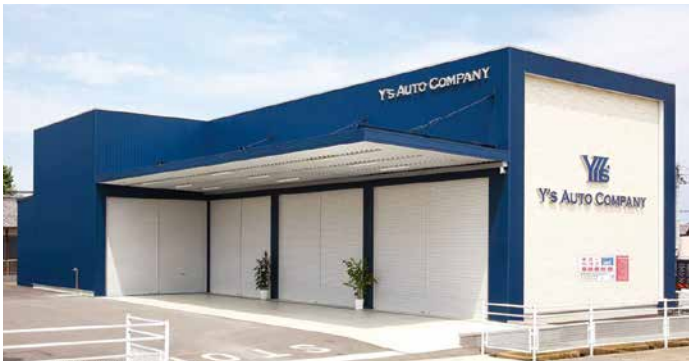
株式会社ワイズオートカンパニー B.P テクノセンター 群馬県藤岡市森