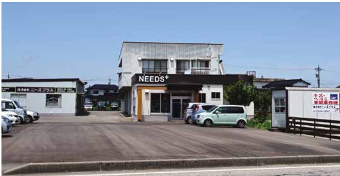
株式会社ニーズプラス 富山県富山市下大久保