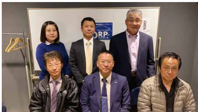
第1回広島地区会 (2020年3月14日)