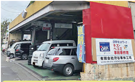
(有)狩谷車体工場 東京都八王子市 ☎042-642-0701