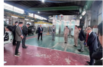
2023年度 北海道ブロック工場見学会 牧口車体工業(有) 2023年5月13日