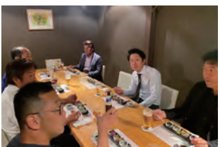
2023年度 第2回鹿児島地区会議 懇親会 2023年6月24日