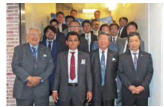
2023年度 第2回全国ブロック長会議 2023年4月22日