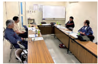
2023年度 第1回大分地区会議 2023年4月5日