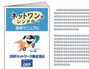
A4判(210×297mm) 8P 全ページカラー