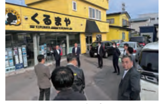
2023年度 北海道ブロック工場見学会 練るまや室蘭 2023年5月13日