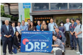
2023年度 イスラエルのダイレクト型保険会社(ID社) 幹部の工場見学 京浜自動車協業組合 2023年6月14日