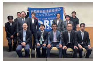
2023年度 第2回九州ブロック地区部長会議 2023年6月10日