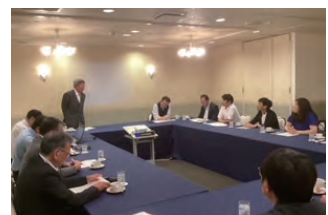
2023年度 福島代協・DRP福島地区合同連絡会議 2023年6月26日