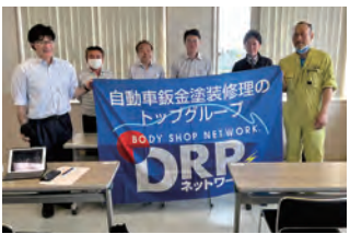
2023年度 第1回新潟地区会議 2023年5月27日