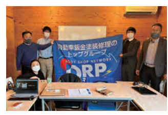
2023年度 第1回中国ブロック地区部長会議 2023年3月4日