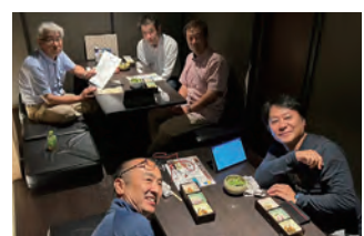
2023年度 第2回大分地区会議 懇親会 2023年6月21日