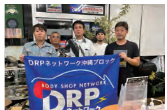
2023年度 第2回沖縄ブロック会議 2023年6月28日