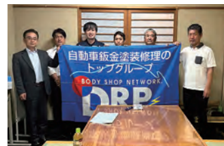
2023年度 第1回熊本地区会議 2023年6月8日