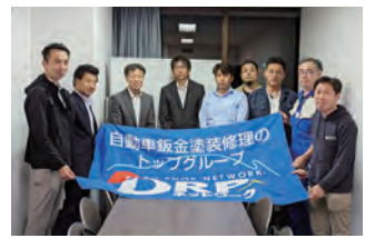
2023年度 第2回北陸ブロック地区部長会議 2023年6月2日