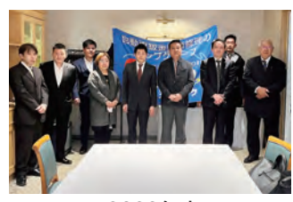
2023年度 第1回四国ブロック会議 2023年3月3日