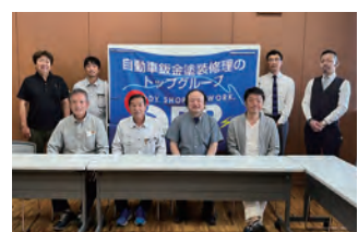
2023年度 第1回群馬地区会議 2023年6月16日