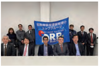
2023年度 第1回九州ブロック地区部長会議 2023年3月11日