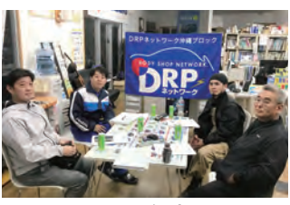
2023年度 第1回沖縄ブロック会議 2023年3月2日