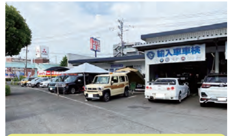
(株)田崎自動車工業 熊本県熊本市 ☎096-358-2940