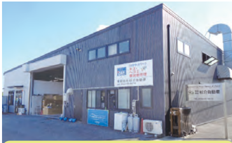
(有)杉介自動車 愛知県小牧市 ☎0568-90-6670