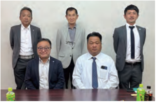
2023年度 第2回中国ブロック地区部長会議 2023年5月12日