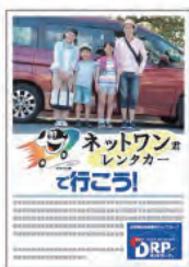
B2判(515×728mm) 4C [2枚]