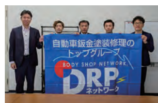
2023年度 第2回青森地区会議 2023年6月24日