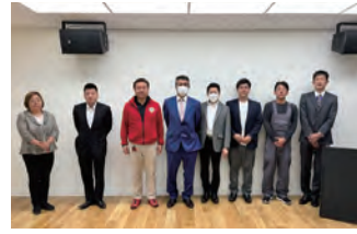
2023年度 第2回四国ブロック会議 2023年5月13日