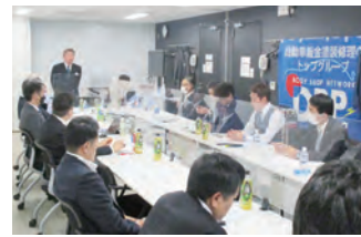
2023年度 第2回全国ブロック長会議 2023年4月22日